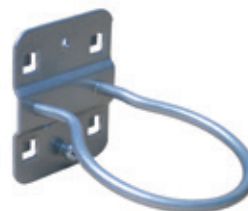
Rundhalter ■ Ø 60 mm